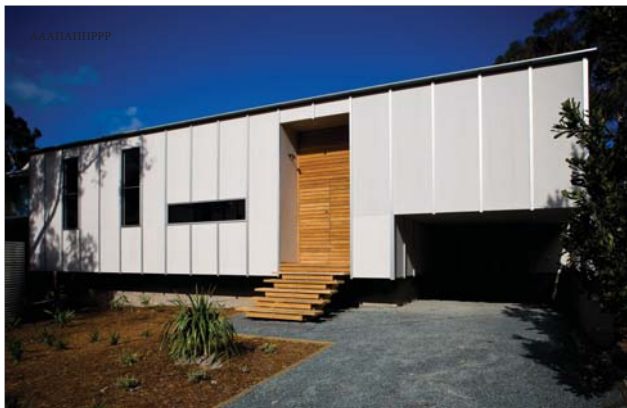
Текст: Наталья Беломыс

Последний из них построили архитекторы из бюро Blue Archibecture. Дом расположен в мифричской зарослях, поэтому и получил название «Мифрич», что на языке австралийских аборигенов означает «миртовый куст». В плане это был простой, но традиционный дом, который хозяева собирались время от времени сдавать в аренду туристам. Архитекторы предложили владельцам создать абсолютно новый объект, при этом сохранив существующий в деревне самобытный, однако постепенно вымирающий архитектурный язык, поэтому внешне «корриж» мало отличается от временных «кабинков», настил сколоченных рыбаками у крошки воды. Концепция близости к природе соблюдается в каждой детали проекта. Архитекторы выбрали экономичные и устойчивые к коррозии материалы и проинтегрировали,